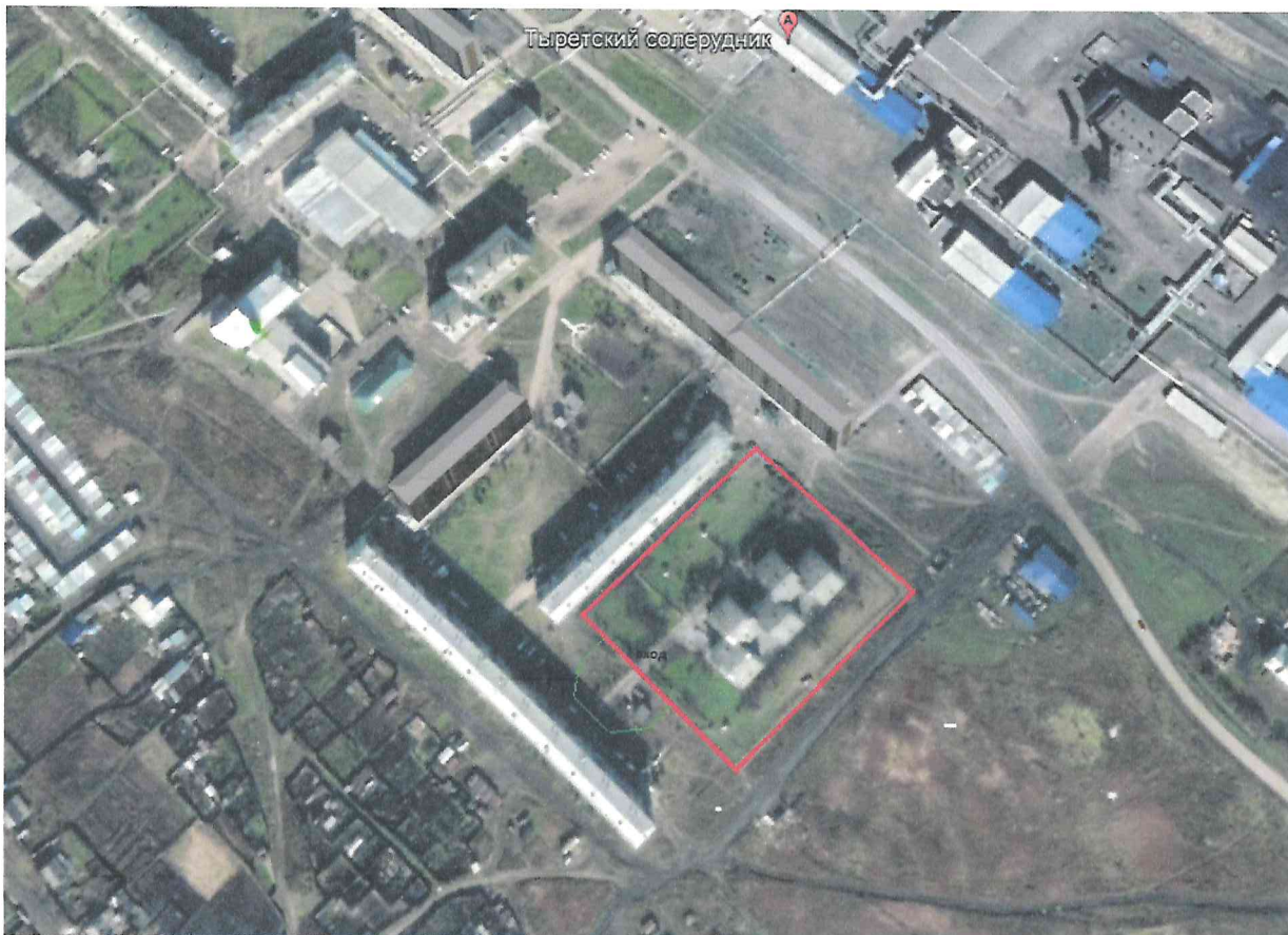
Схема границ прилегающих территорий к муниципальному бюджетному общеобразовательному учреждению Солерудниковская гимназия (начальная школа), Иркутская область, Заларинский район, р.п. Тыреть 1-я, мкр. Солерудник, 22