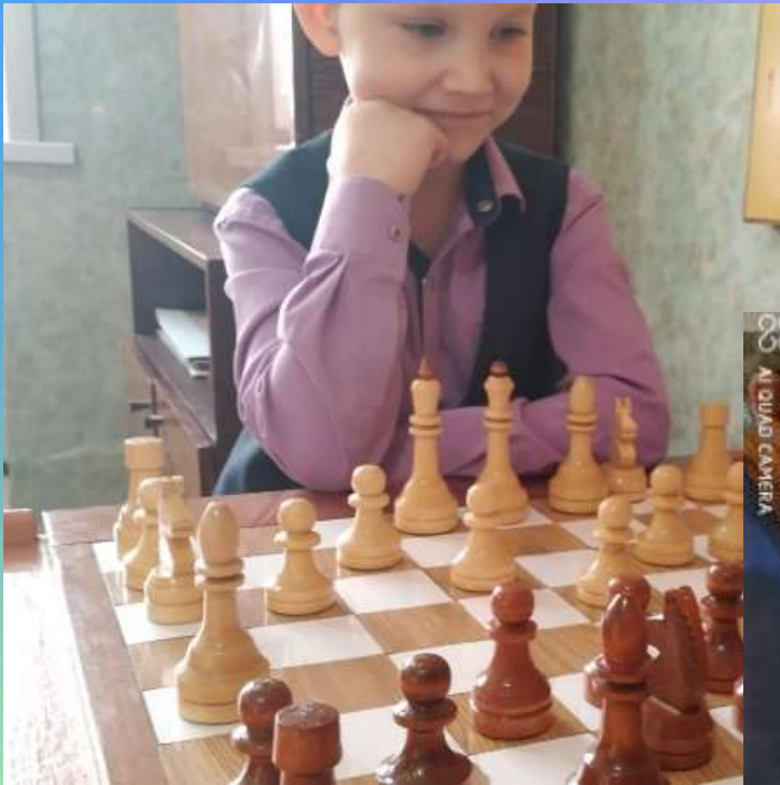
Наши районные турниры