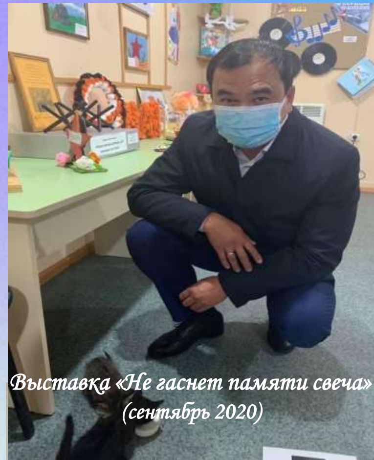
Выставка «Не гаснет памяти свеча» (сентябрь 2020)