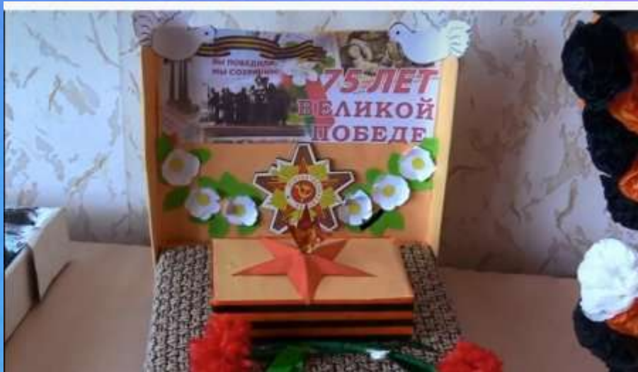
Выставка «Не гаснет памяти свеча» (май 2020)