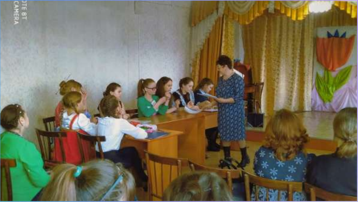
Конкурс «Лидер года»