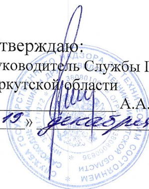
График проведения технического осмотра тракторов, самоходных дорожно-строительных и иных машин и прицепов к ним Заларинским подразделением Службы Гостехнадзора Иркутской области на 2024 год